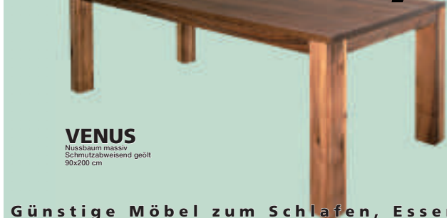
VENUS Nussbaum massiv Schmutzabweisend geölt 90x200 cm