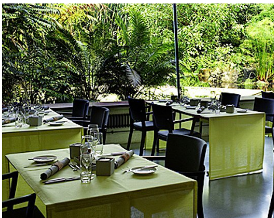
Erstklassig dinieren und dabei zusehen, wie Flughunde in der tropischen Masoala-Halle ihre Runden drehen.

Hamam im Volkshaus: Seit hundert Jahren wird im Volkshaus an der Stauffacherstrasse 60 gebadet. Einst befanden sich in Einzelkabinen