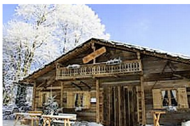
Neues Fondue-Chalet bei Sihlcity.

Fondue im Chalet: Gerade eben hat beim Einkaufszentrum Sihlcity das Fondue-Chalet eröffnet. Es verspricht uriges Alpenfeeling mitten in der Stadt. Auf der Karte stehen verschiedene Fondues, der Klassiker moitié-moitié, mit schwarzem Trüffel, Kräutern oder Eierschwämmli. Neben