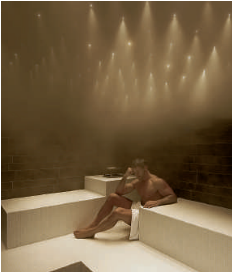
Im Dampfbad Wärme tanken und draussen im Whirlpool (Bild rechts) relaxen. Im Wellnesshotel Golf Panorama in Lipperswil ist das jetzt auch für Tagesgäste möglich. Im Eintrittspreis ist ein 3-Gang-Vitalmenü inbegriffen (siehe Bild unten).